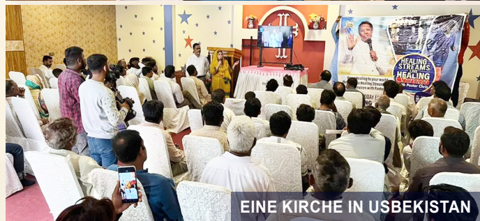
EINE KIRCHE IN USBEKISTAN