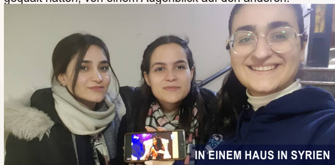
IN EINEM HAUS IN SYRIEN

Wo jemand sich befand spielte weder eine Rolle noch war es ein Hindernis für das mächtige Wirken des Geistes Gottes. Da war so viel Jubel als die verschiedensten Wunder an den unterschiedlichsten Orten überall auf der Welt geschahen; Wohnungen, Büros, Krankenhäuser, Autos, Kirchen, Parks und Heilungszentren waren von allen Ländern der Erde aus mit dem Programm verbunden. Lahme konnten gehen, blinde Augen sahen, taube Ohren öffneten sich und alle Arten von Krankheiten verschwanden. Für so viele endeten schreckliche Umstände, hoffnungslose Situationen und Entbehrungen, die sie so lange gequält hatten, von einem Augenblick auf den anderen.