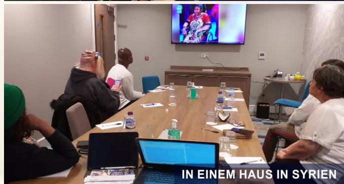
IN EINEM HAUS IN SYRIEN