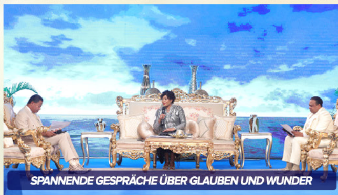
SPANNENDE GESPRÄCHE ÜBER GLAUBEN UND WUNDER