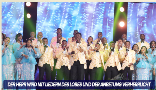
DER HERR WIRD MIT LIEDERN DES LOBES UND DER ANBETUNG VERHERRLICHT