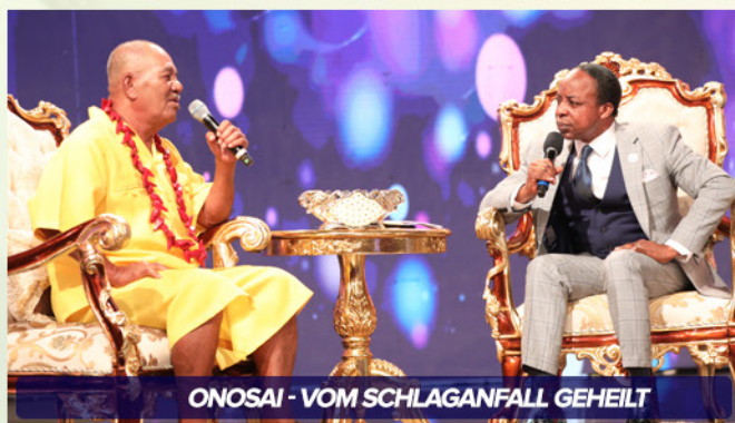
ONOSAI - VOM SCHLAGANFALL GEHEILT