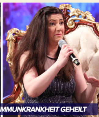
GNADE - VON EINER AUTOIMMUNKRANKHEIT GEHEILT