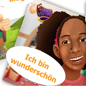
Ich bin wunderschön Chris Oyakhilome