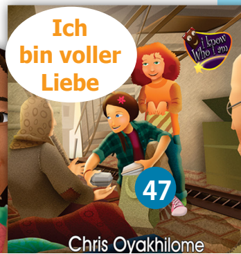
Ich bin voller Liebe Chris Oyakhilome

Kinder können jeden Tag siegreich leben, wenn sie wissen, was sie in sich haben. Helfen Sie ihnen mit diesen interessanten Geschichtenbüchern aus der Reihe «Ich weiß, wer ich bin» zu entdecken, wer sie wirklich in Christus sind, und beobachten Sie, wie sie werden, wie Gott es für sie beabsichtigt hat.