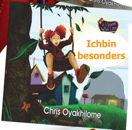
Ich bin besonders Chris Oyakhilome