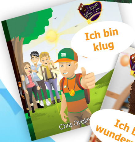
Ich bin klug Chris Oyakhilome