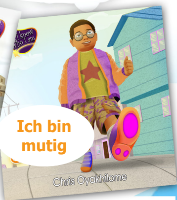
Ich bin mutig Chris Oyakhilome