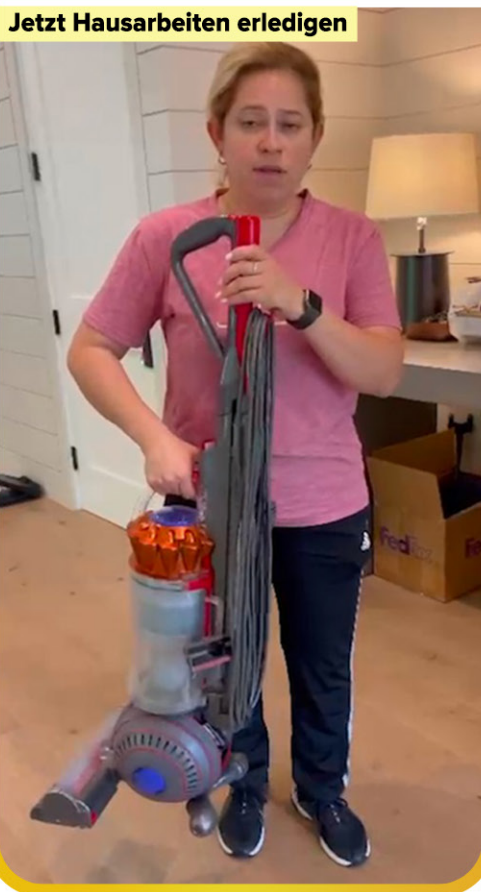
Jetzt Hausarbeiten erledigen