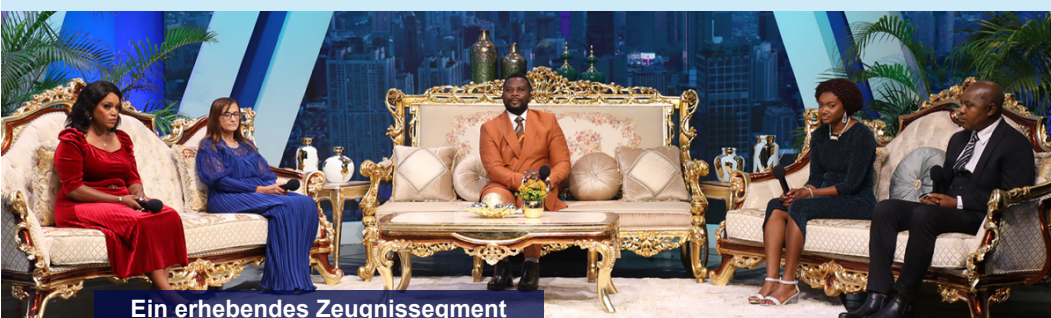
Ein erhebendes Zeugnissegment

Verpasse nicht die nächste Ausgabe des Globalen Wunderglauben Seminars. Es wird eine weitere großartige Gelegenheit sein, unsere Siege aus den gerade beendeten Live-Heilungsgottesdiensten zu festigen. Es verspricht, eine schicksalsverändernde Erfahrung zu werden.