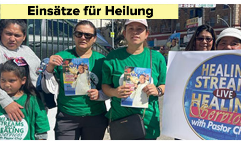
Einsätze für Heilung