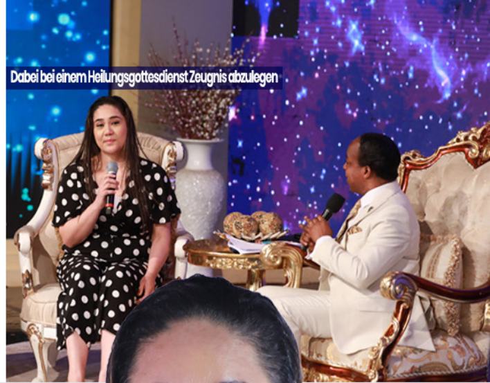
Dabei bei einem Heilungsgottesdienst Zeugnis abzulegen

Sie beschreibt ihre Erfahrung: „Als Pastor Chris ankam, wurde mein Glaube gestärkt, und ich stellte mir voller Spannung den Moment meines Wunders vor Augen. Als er begann, die Teilnehmer aus aller Welt zu beten, empfing ich meine Heilung und dankte Gott, dass er mich berührt und meinem kranken Körper Kraft und Leben zurückgegeben hatte. Ich bin frei. Endlich bin ich von Schmerzen und jeder Situation, die mich gefangen hielt befrei.