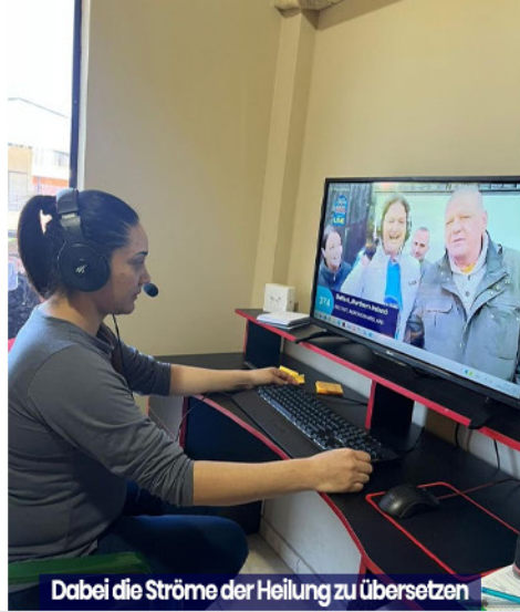
Dabei die Ströme der Heilung zu übersetzen