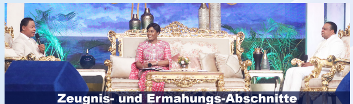
Zeugnis- und Ermahnungs-Abschnitte