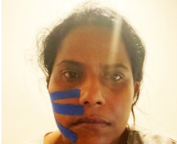
Ashie Gesicht, gehalten mit einem Band, das Fallen zu stoppen.

Die Dinge wurden jedoch durch verschiedene Komplikationen nach den Operationen schlimmer. Ashi erlitt im rechten Ohr Taubheit. Lähmungen im